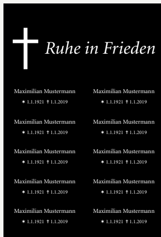
Familien-/Freundschaftsschild mit Namen, Datum, Kreuz und Spruch