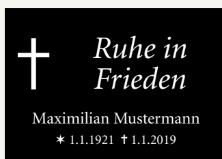
Einzelschild mit Namen, Datum, Kreuz und Spruch