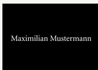
Einzelschild mit Namen