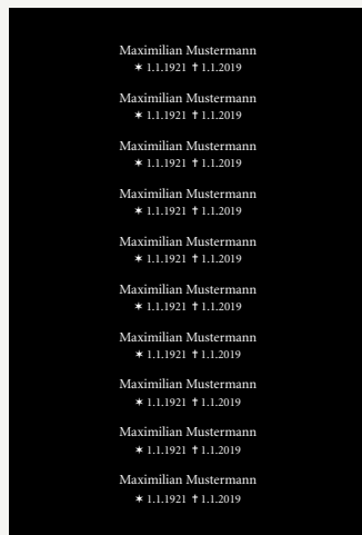
Gemeinschaftsschild mit Namen und Datum