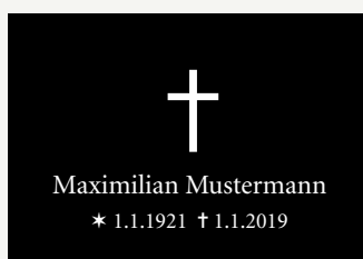
Einzelschild mit Namen, Datum und Kreuz