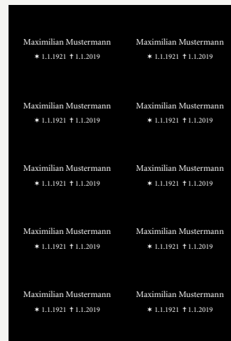
Familien-/Freundschaftsschild nur mit Namen und Datum